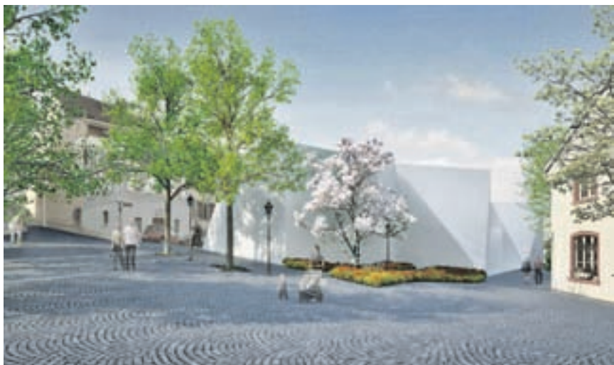
Erweitert. Der Lindenplatz und der steil ansteigende Rumpel (links) erhalten mit den Bauten (Mitte) ein neues Gesicht.