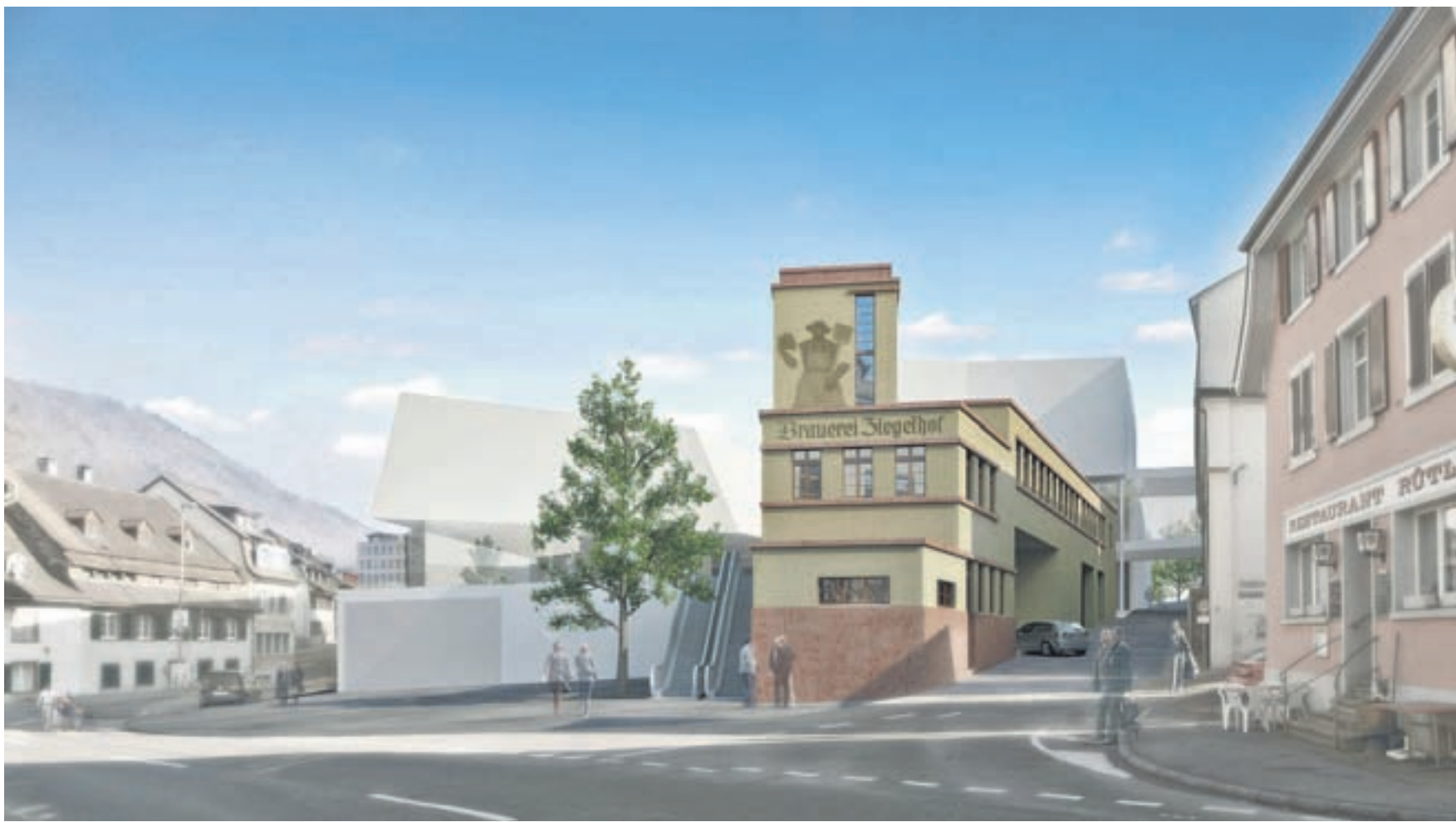
Alt und Neu. Blick von der Gerberstrasse auf die geplante Geschäfts- und Wohnüberbauung auf dem ehemaligen Brauereiareal. Visualisierungen Vehovar & Jauslin Architektur