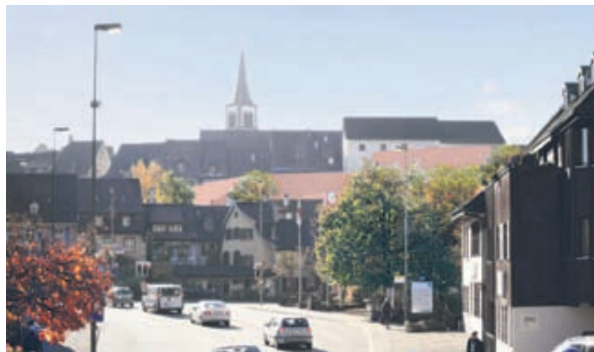
Eingriff. Die Überbauung würde die Altstadt teilweise verdecken. Sicht von der Arisdörferbrücke aus, geplante Gebäude von der BaZ rötlich eingefärbt.